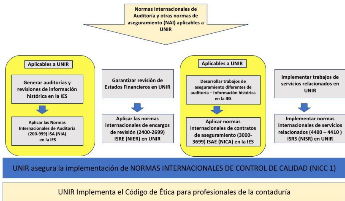
Figura 1. Esquema de las Normas Internacionales de Auditoría (NIAs)

Según la Ley 1314 de 2009, las Normas de Aseguramiento de la Información comprenden normas éticas, de control de calidad, auditoría, y revisión.