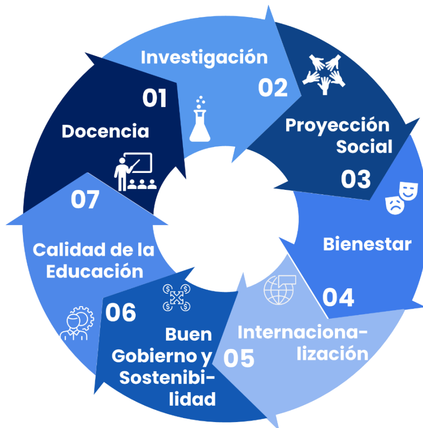
Figure 3. Ejes estratégicos y funciones sustantivas y adjetivas del Plan de Desarrollo Institucional 2023-2030

Para dar respuesta a la articulación de los objetivos institucionales y de acuerdo con el Plan de Desarrollo Institucional 2023-2030, se tendrán establecidos los ejes para la alineación estratégica en la estructuración de siete (7) ejes que sustentan el desarrollo integral de la misma. Estos siete (7) ejes son: