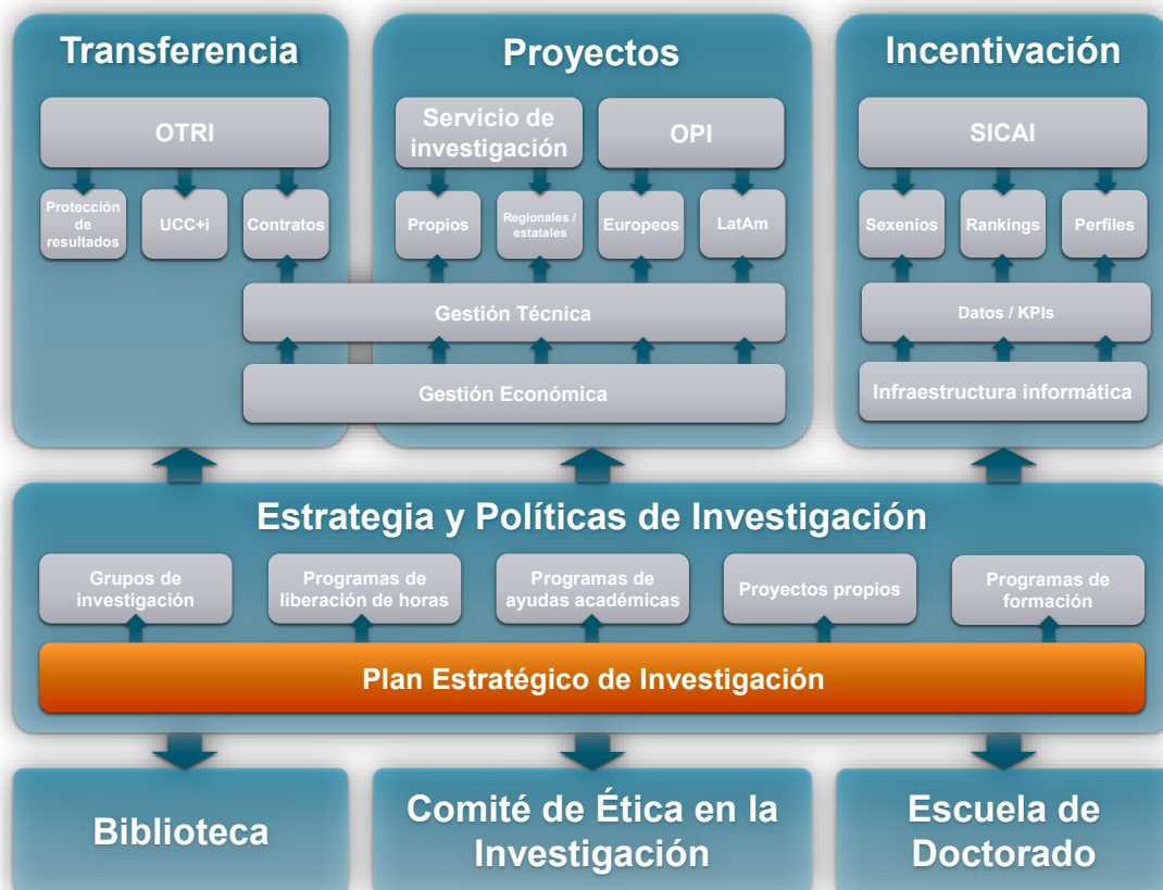
Figura 4. Ámbito de actuación del Plan Estratégico de Investigación

Por otro lado, la operativa de los diferentes programas del Plan Estratégico de Investigación se desarrolla a partir de la actividad del Vicerrectorado de Investigación y del Vicerrectorado de Proyectos Internacionales, con el apoyo estratégico del Vicerrectorado de Ordenación Académica y Profesorado.