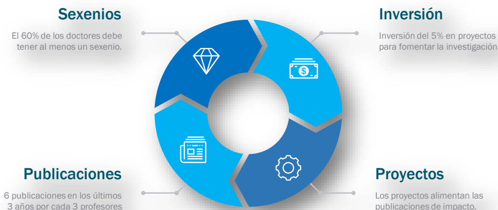
Figura 1. El ciclo de la inversión en investigación.

Todos estos requisitos proponen una estrategia coherente, tal y como se señala en la Figura 1. Partiendo de la inversión en programas para incentivar la investigación se debe incentivar la participación en proyectos competitivos. Como resultado de estos proyectos, se obtienen resultados que alimentan las publicaciones del personal docente e investigador, y a partir de estas publicaciones se solicitan los tramos de investigación o sexenios por parte del personal.