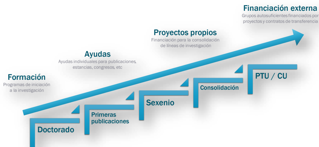
Figura 3. La escalera hacia la consolidación

En cualquier caso, el foco de este Plan Estratégico de Investigación es poner a disposición de los investigadores y de los grupos de investigación los medios necesarios para desarrollar sus capacidades investigadoras, con múltiples programas orientados a apoyar en las diferentes etapas del proceso de consolidación.